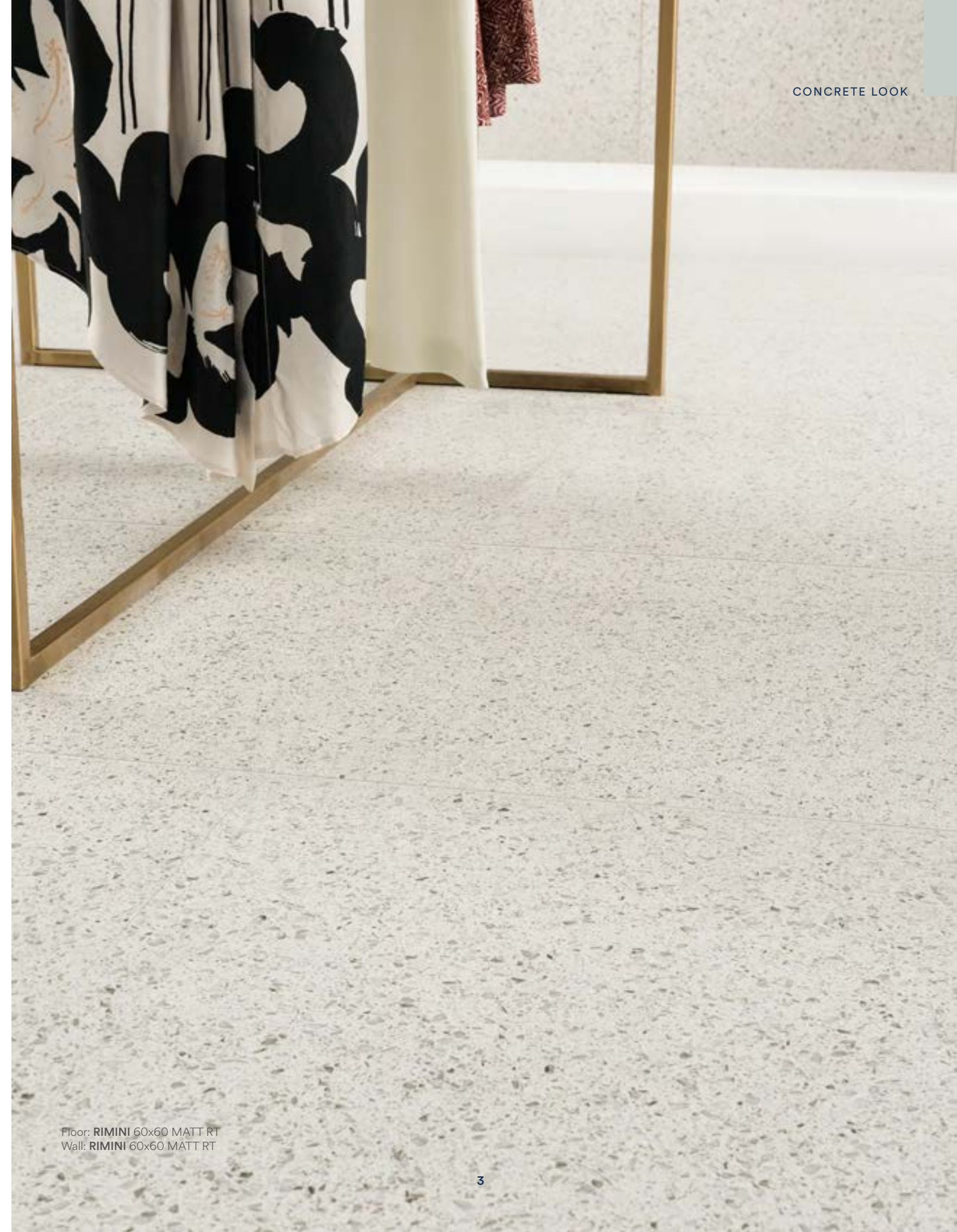
Floor: RIMINI 60x60 MATT RT Wall: RIMINI 60x60 MATT RT